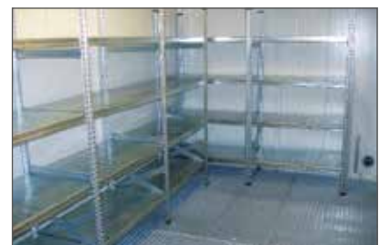
BLS sisä näkymä, jossa hyllyt pienille astioille (optio)