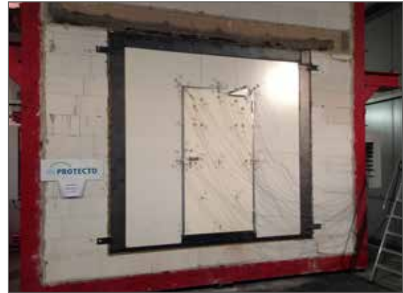
Valmistelu palonkestotestiä varten