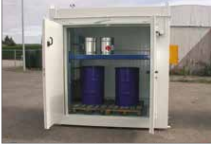
BLS 2226 R

Jos vaarallisia aineita sisältäviä tynnyreitä kuljetetaan trukilla ja varastoidaan IBC-kontteihin, BLS palonkestävä hyllyllinen kontti on oikea ratkaisu. Palonkestävä varastointihylly BLS R täyttää kaikki vaaditut turvakonttien vaatimukset. Soveltuu sisä- ja ulkotiloihin. Palonkestävä noin 90 minuuttia.