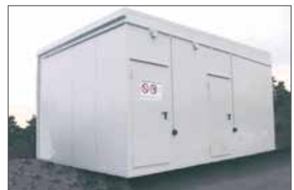
BLS 2960 kahdella ovellalla