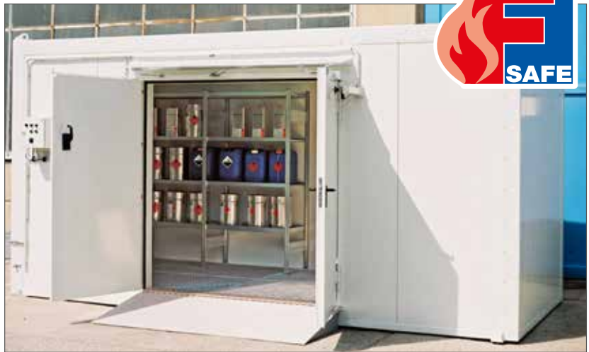
BLS 2460 pariovella pitkällä sivulla ja liuskalla (optio)