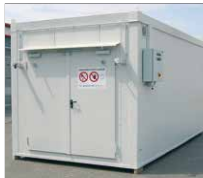
BLS 2960 pariovella lyhyellä sivulla